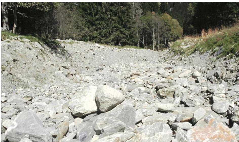
Abb. 1: Dieser Seitenbach der Moesa südlich des San Bernardino/GR gleicht mehr einer Steinwüste als einem Fluss. Gewisse Politiker wollen die Wasserkraft für die Energiewende noch extremer nutzen...

gelrecht weggespült und getötet. Es ist höchste Zeit, diese Strecken zu sanieren. Einige Kraftwerkbetreiber zeigen, wie es geht, z.B. die Alpiq in Rupoldingen bei Olten oder die Repower in der Cavaglia-Ebene. Zu viele Betreiber bleiben jedoch untätig, obwohl die Gesetzeslage klar ist.