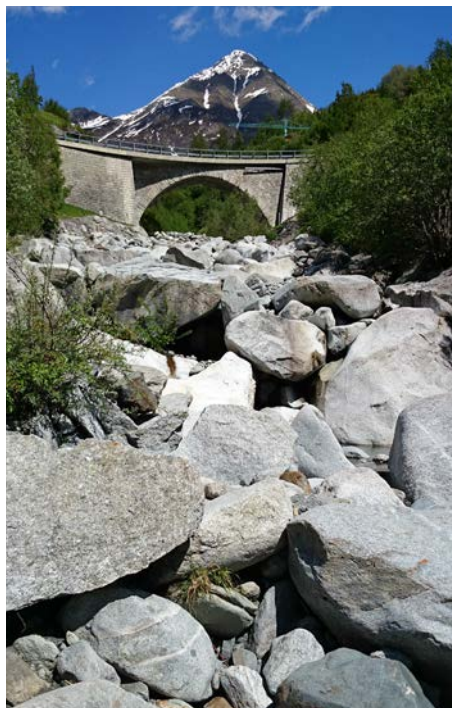
Abb. 2: Der Rein da Platta, Val Medel/GR, von der KVR/NOK/AXPO trockengelegt.

Wasserlebewesen reagieren besonders empfindlich auf die starken künstlichen Pegelschwankungen, die durch Schwall und Sunk verursacht werden. Arbeiten die Turbinen auf Hochtouren, werden Fische vom „Tsunami“ re-