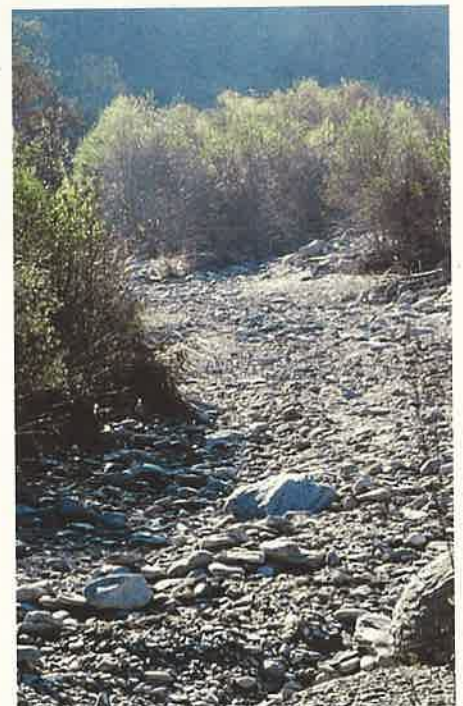
Abb. 1: Der von der NOK/AXPO trocken gelegte Rhein da Sumvitg mit ganzflächiger Zerstörung der Biodiversität inkl. Uferbereiche

«Wasser ist verletzlich und zerstörbar. Wasser ist ein Menschenrecht. Wasser ist Existenzgrundlage. Wasser ist klimarelevant. Wasser ist Leben. Wir haben die Wahl.»