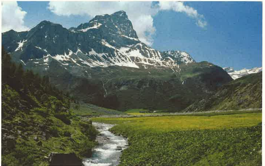
Abb. 2: Ein sonniger Tag in der abgelegenen Val Bercla in Graubünden.

Der Wasserkraft fehlt schlicht das Potential, um die Energiewende zu meistern, ganz im Gegensatz zur Solarenergie. Die neue Solarstrom Potentialstudie der Solar Agentur Schweiz belegt mit gemessenen Werten, von Mietern/Hauseigentümern/innen und KMU, dass sie jährlich 127 TWh bis 435 TWh oder 100 % bis 180 % des Gesamtenergiebedarfs der Schweiz CO 2 -frei versorgen können. Das sind 150 Mal mehr CO 2 -freier Solarstrom